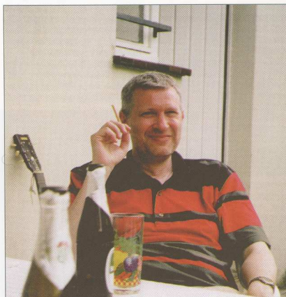
Artiklens forfatter, der – ud over at undervise på EUC NORD's kursuscenter – er med til udvikling af projekter og undervisning og har været redaktør af handelsskolens "Året der gik". Han er uddannet folkeskolelærer med en "overbygning" som cand.merc. og merkonom.

Stort udviklingsarbejde Siden Handelsskolens Kursuscenter startede i 1992, har vi så småt arbejdet med undervisning via Internettet. Men det er først fra 1997, det år undervisningen i PC-kørekort over Internettet tog fart, vi mere systematisk har arbejdet med at få indsigt i de læringsmæssige processer, der finder sted ved udvikling, tilret-